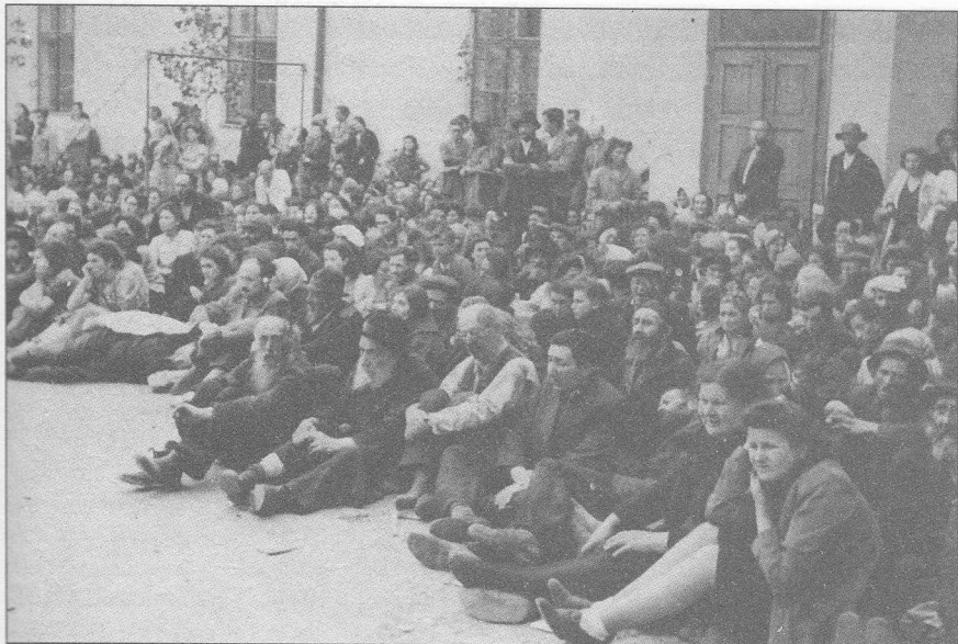
Figura 17 — Evrei obligați să se strângă laolaltă în timpul reocupării Basarabiei de către România