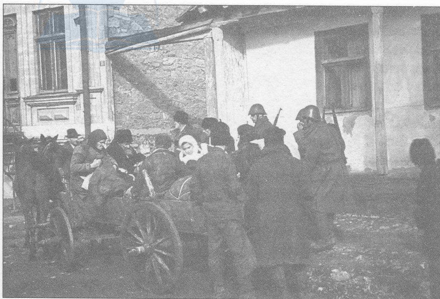
Figura 16 — Evrei bătrâni, cu bagaje, încărcăți într-o căruță pentru deportarea din ghetoul din Chișinău spre Transnistria, octombrie 1941.